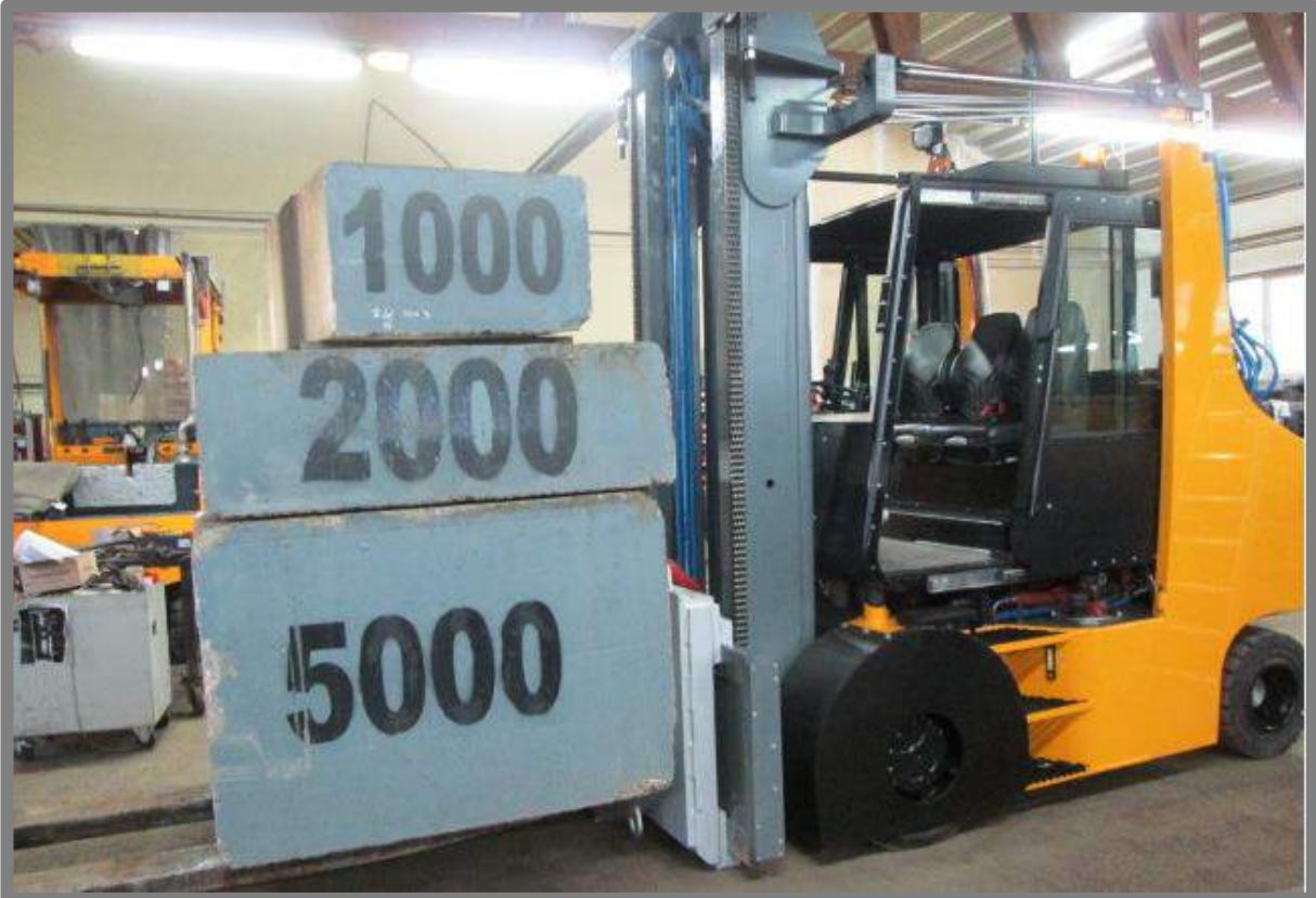
Vue détaillée de chariot diesel protection thermique