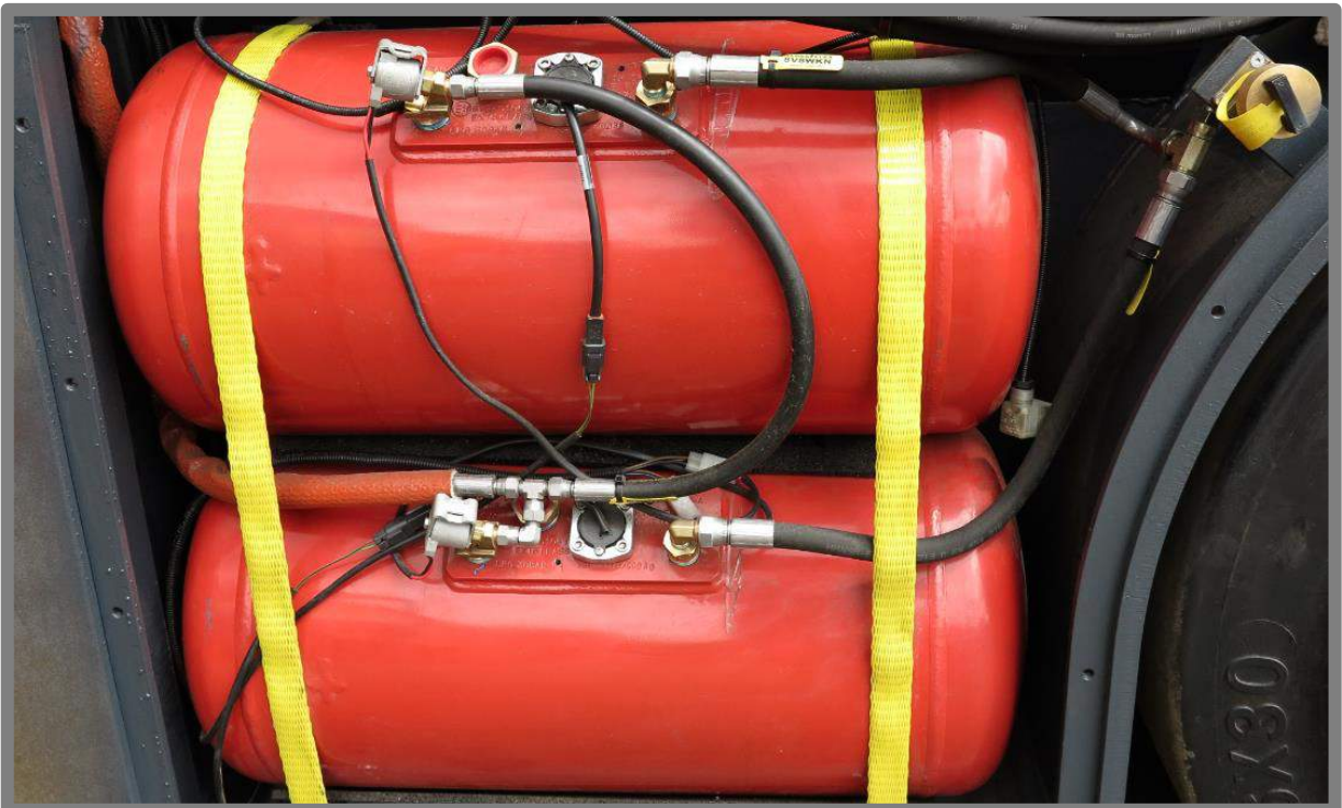
Vue détaillée d'un chariot à gaz