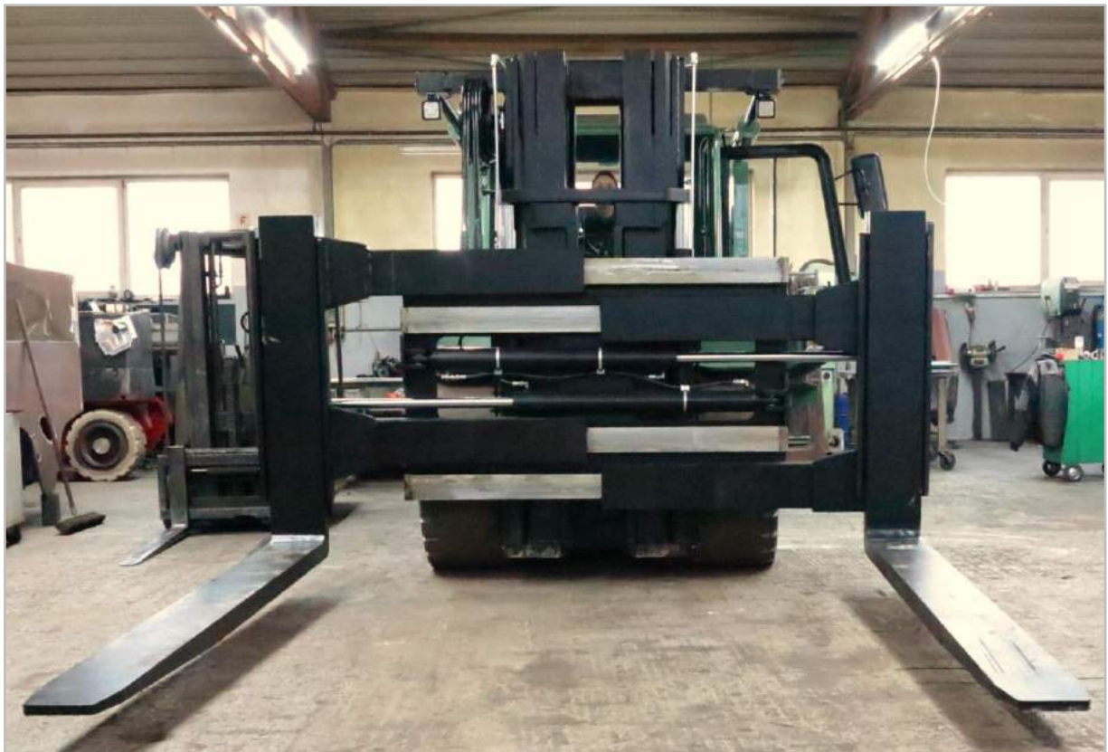
Réglage maximal des fourches d'un chariot électrique MKF de 20 tonnes